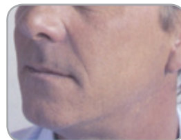
Före krämens användning