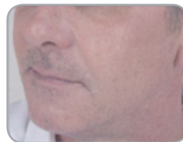
12 månader efter krämens användning